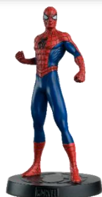
スパイダーマンフィギュア 創刊号～第35号をご購入の方