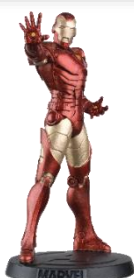
アイアンマンフィギュア 第36～第60号をご購入の方