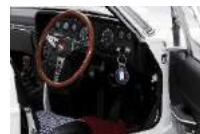
アクセルONでエンジン音も再現