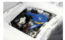
エンジンルームも忠実に再現