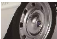
個性的なホイール