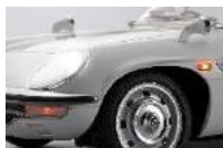
ライト類はリモコン操作で点灯